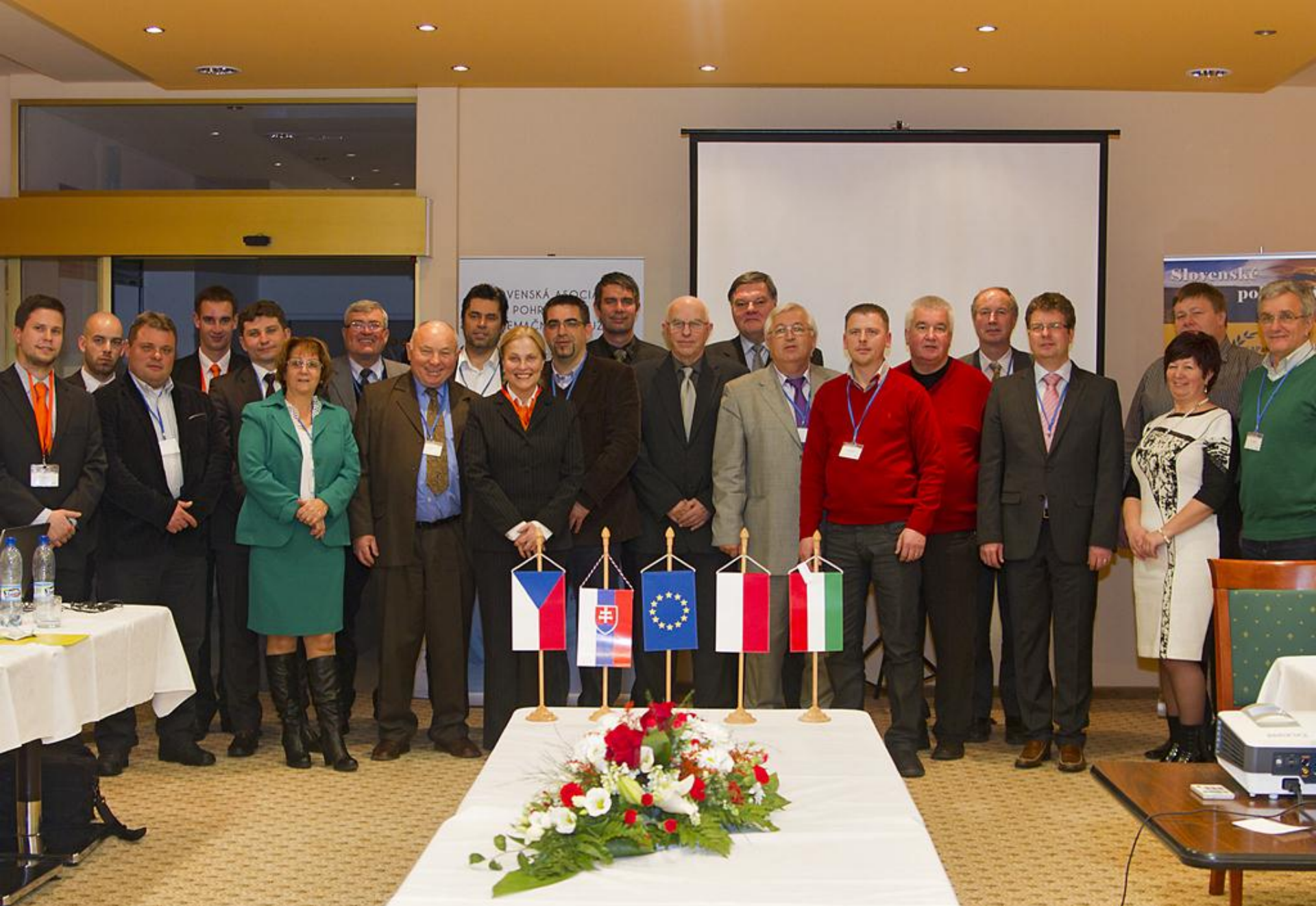
Prípravné stretnutie organizácie konferencie „Právo na ľudskú dôstojnosť“