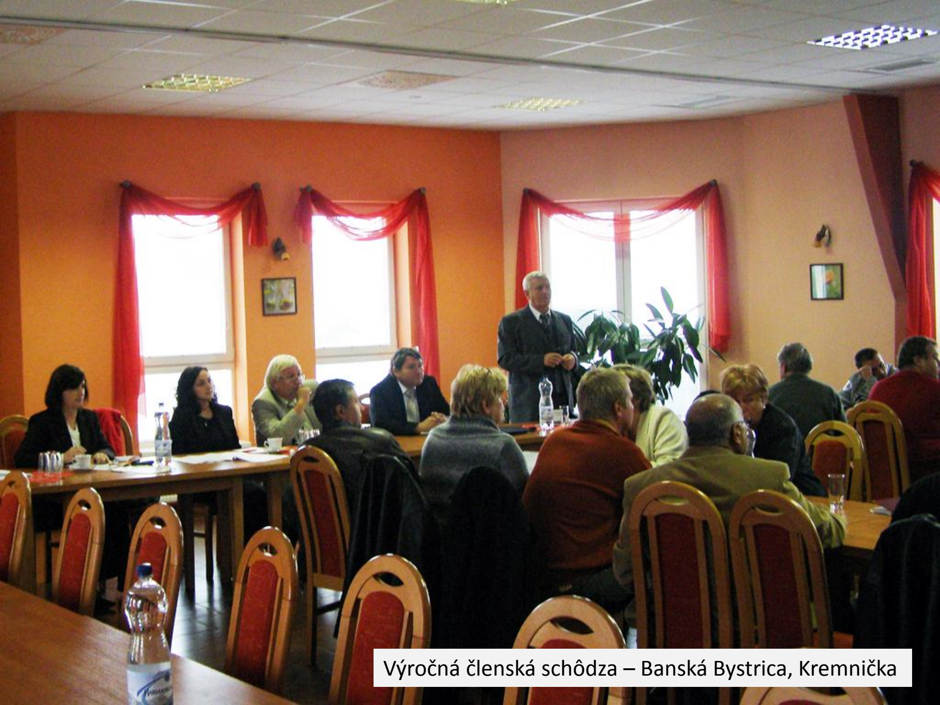
Výročná členská schôdza – Banská Bystrica, Kremnička