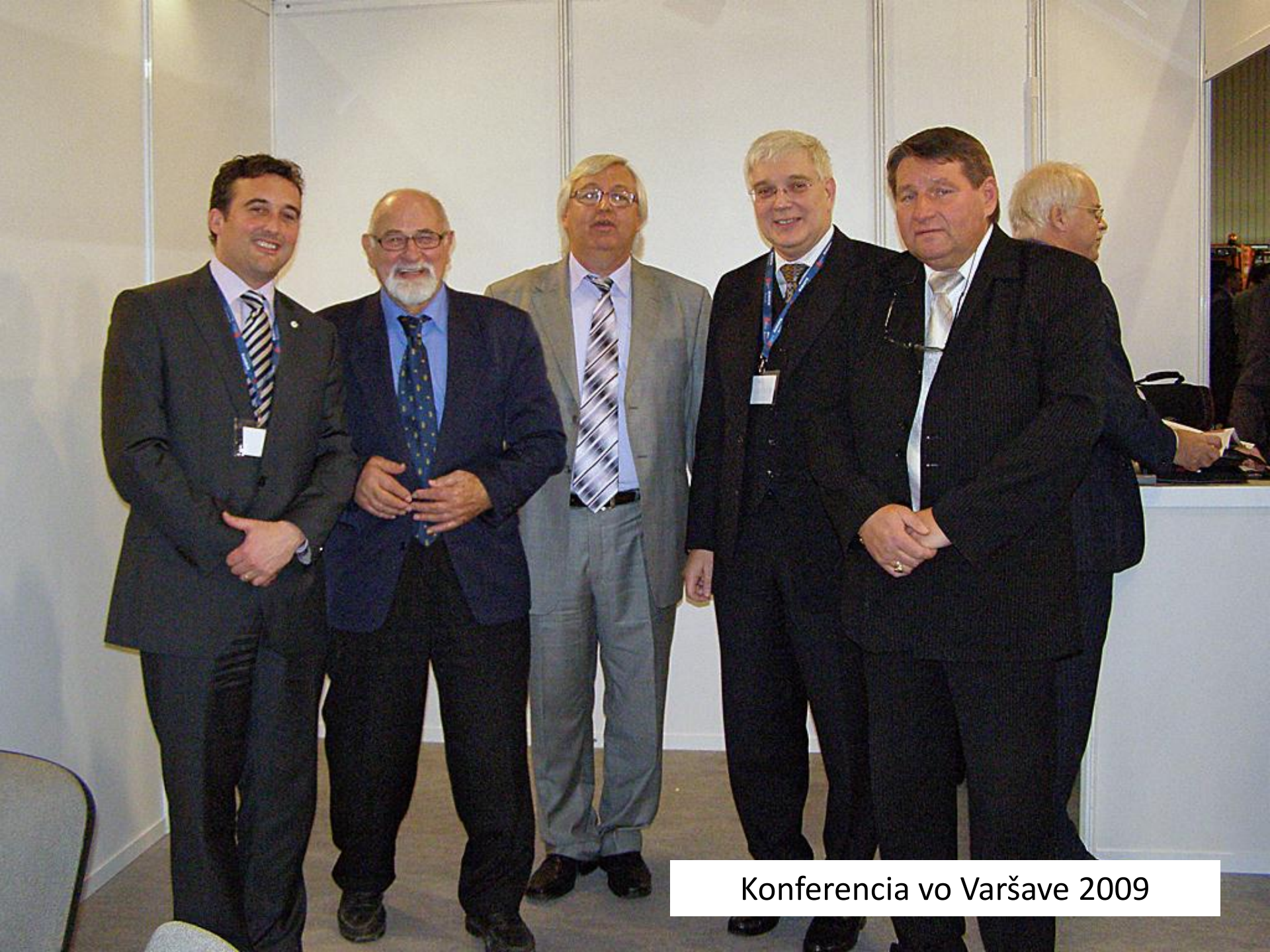
Konferencia vo Varšave 2009