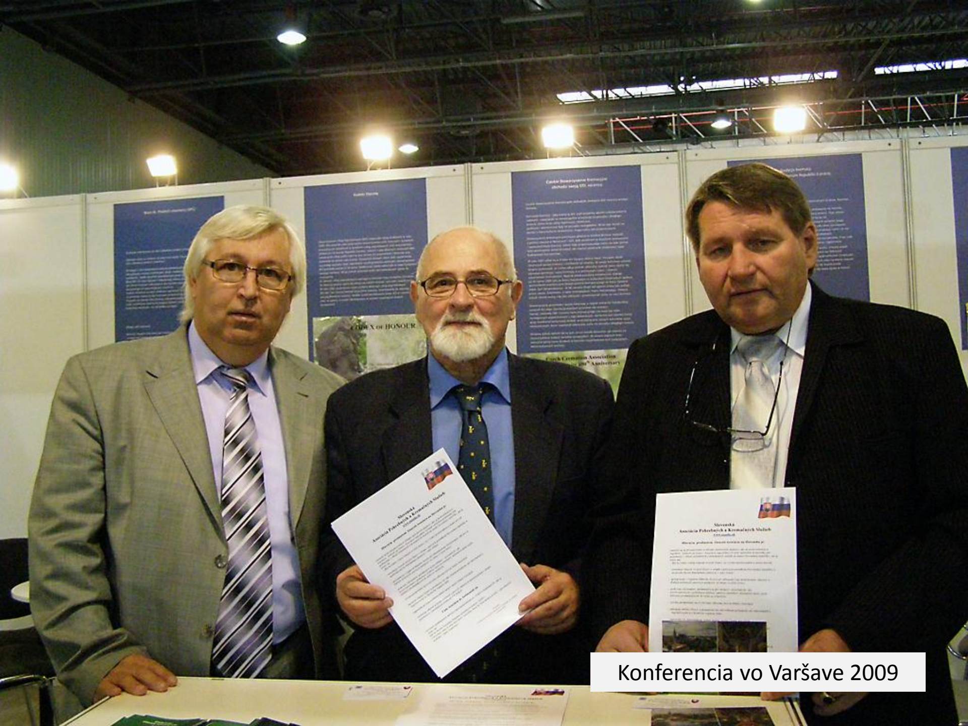
Konferencia vo Varšave 2009