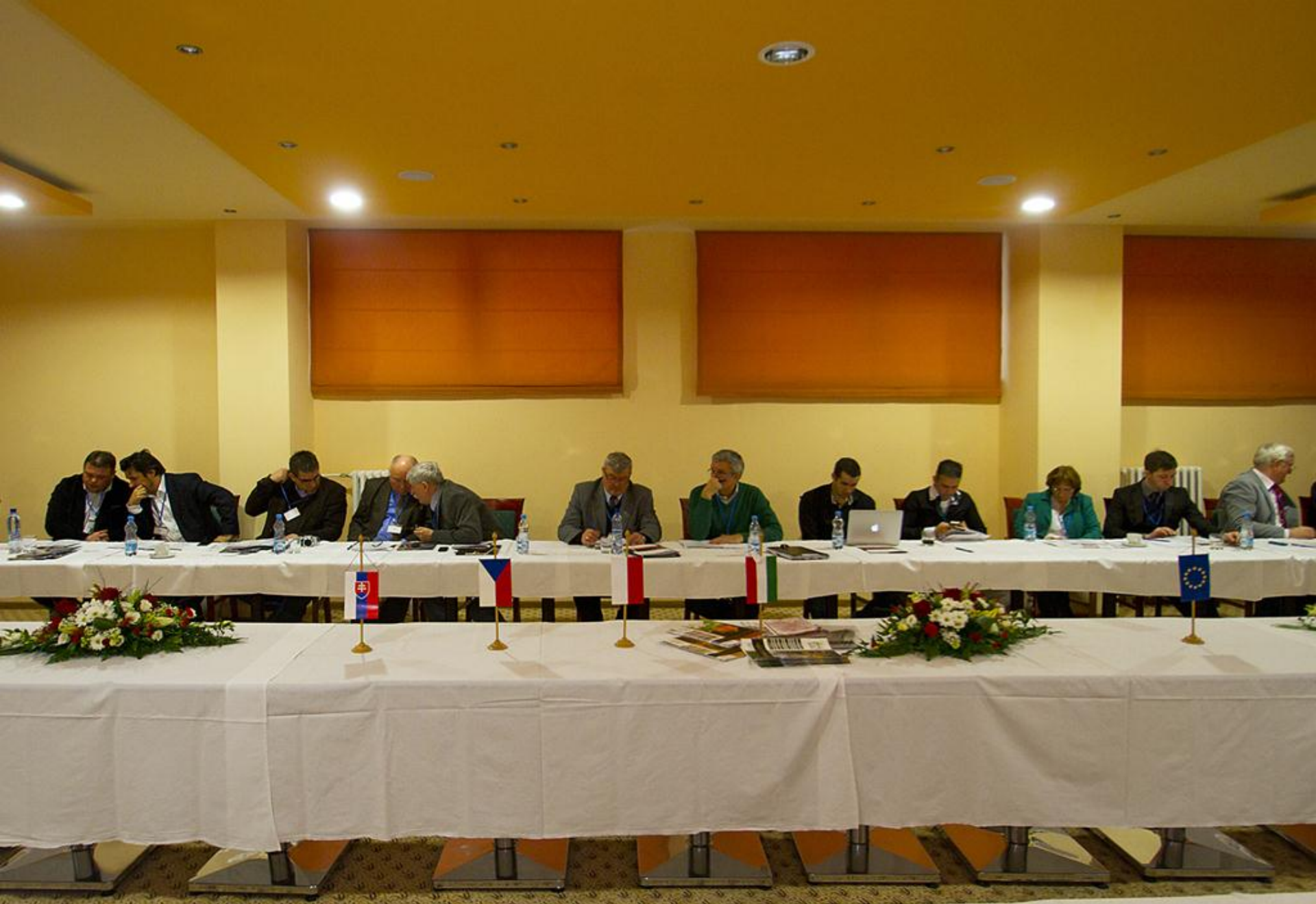
Prípravné stretnutie organizácie konferencie „Právo na ľudskú dôstojnosť“