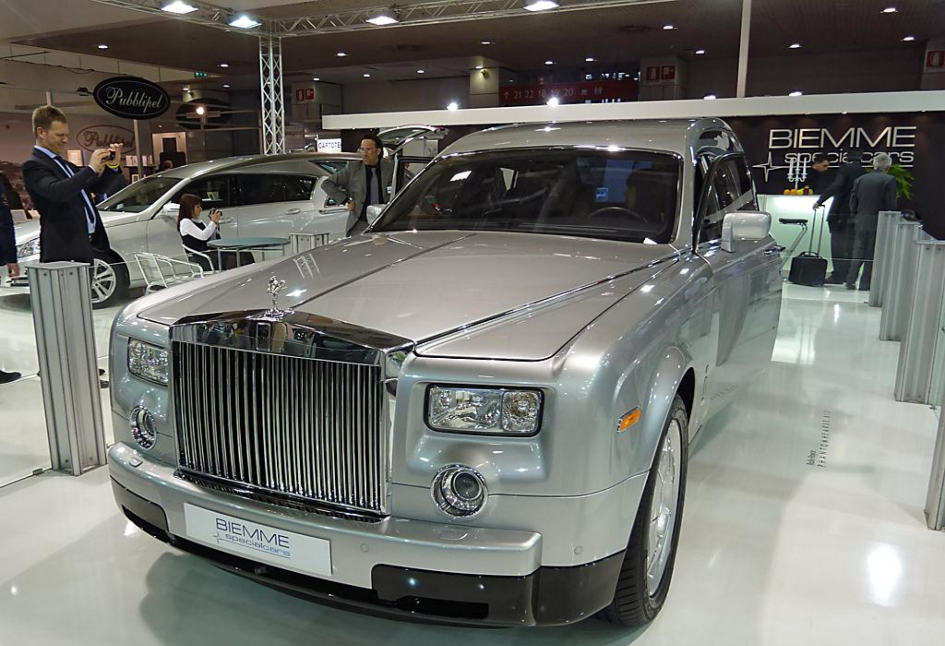
ROLLS-ROYCE PHANTOM pohrebné vozidlo za 500.000 €, výstava Bologna 2012